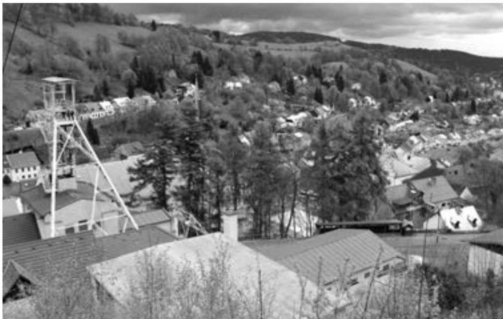
▲ Jáchymov. Město s pohnutou historií a stále stojící těžní věží, dnes UNESCO.