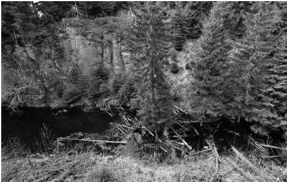
▲ Rote Grube. Tahle skalnatá jáma po těžbě je nyní v Krušných horách chráněna UNESCO.