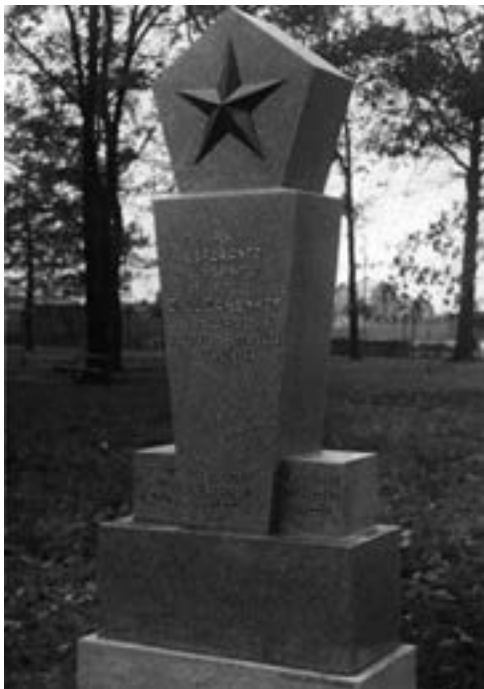
◀ Pomník esperanta v původní podobě krátce po svém odhalení v Bohumínských městských sadech.

stromy. Lidé z této části města tak získali malebný prostor pro setkávání. Druhou světovou válku přečkal sad bez zásahů, a tak i po válce zpřijemňoval sad čekání nejen na tramvaj směřující do Vítkovic a Bělského lesa.