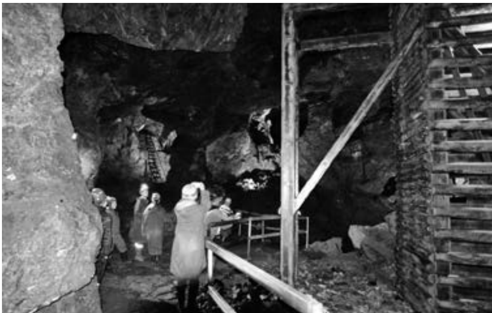
▲ Monumentální rudný důl Johannes v Krušných horách je dnes zpřístupněn pro veřejnost.

projekt je vágní a nesplňuje kvalifikační kritéria. Ztráta prestižní známky se na rozdíl od zápisu v roce 2008 obešla bez mediálního zájmu.