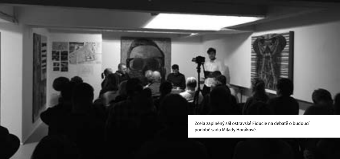
Zcela zaplněný sál ostravské Fiducie na debatě o budoucí podobě sadu Milady Horákové.