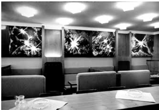
▲ Denní bar Hvězda Ostrava, výzdoba Petr Sikula