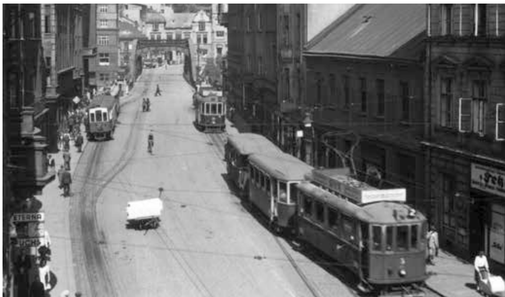
▲ Od roku 1917 do roku 1950 fungovala v Mor. Ostravě na předmostí Říšského mostu (dnes most Miloše Sýkory) přestupní stanice mezi vlaky Moravsko-ostravských místních drah a spoji Slezských zemských drah do Michálkovic a Bohumína.