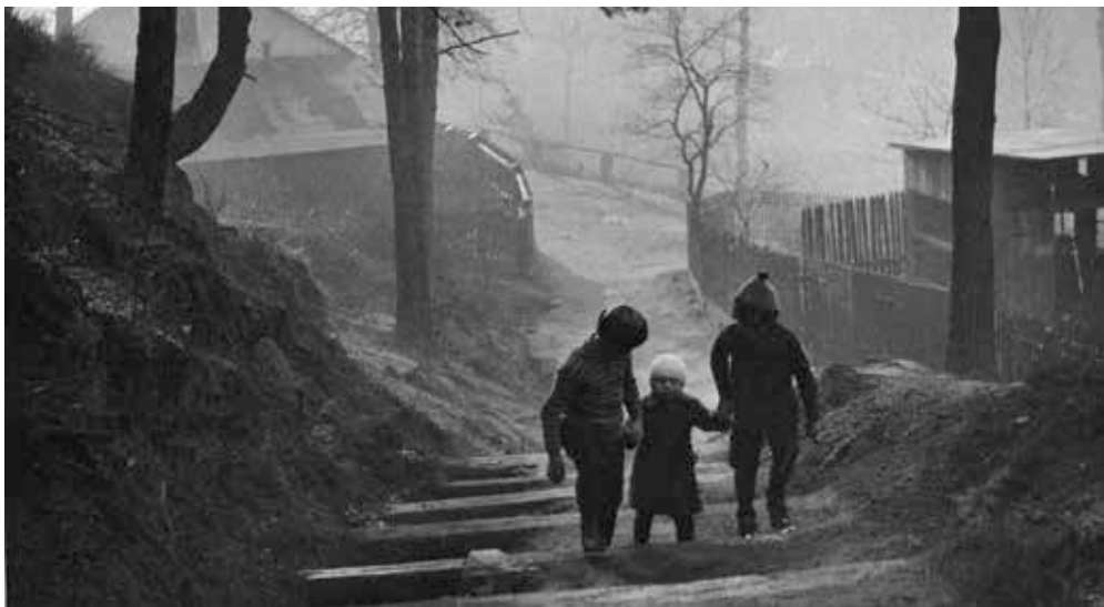
▲ Kolonie v ostravsko-karvinském revíru.