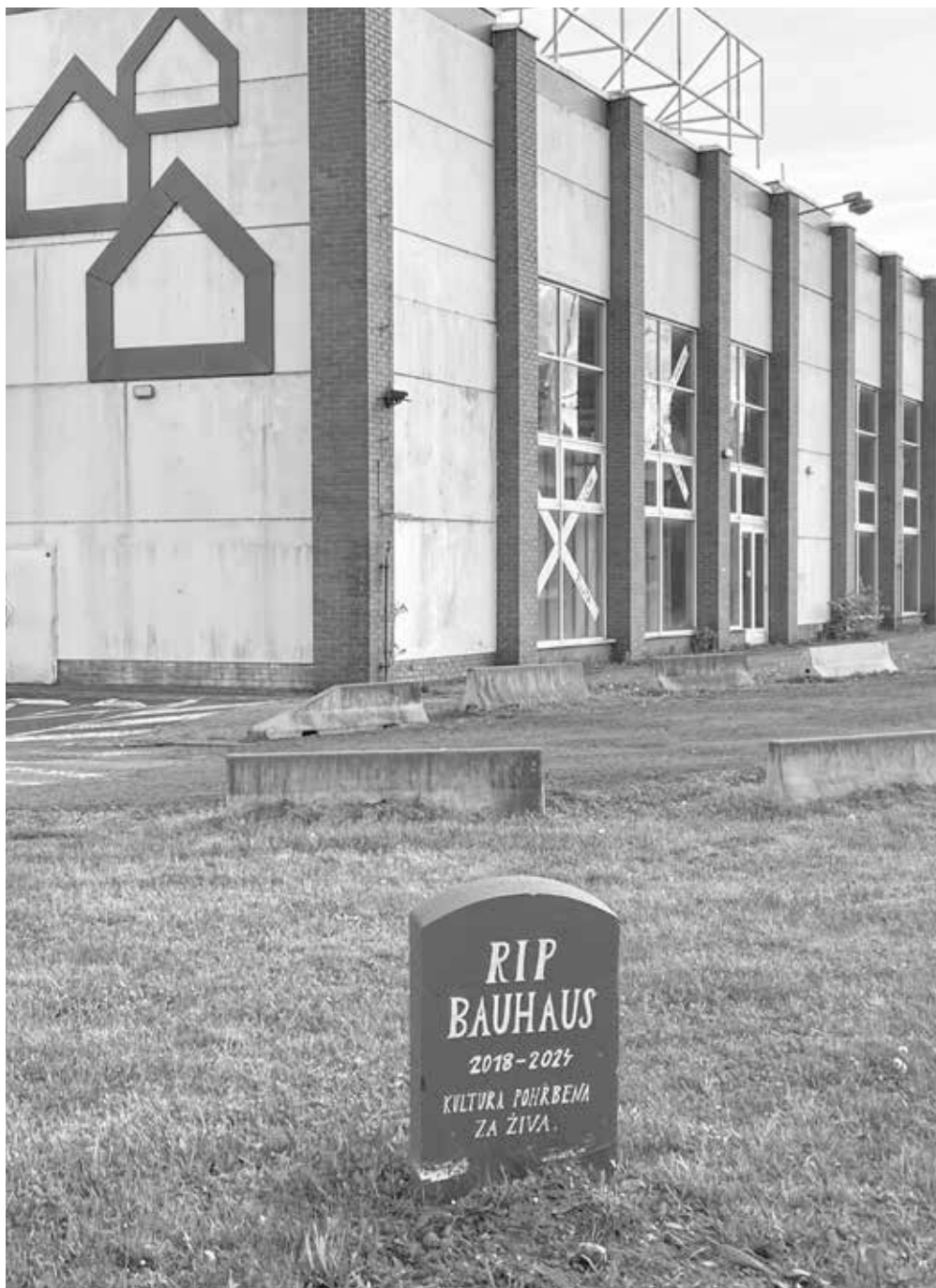
▲ Symbolický hrob Bauhausu vznikl v rámci performance umělců na Štáfetě pro Bauhaus v únoru 2024.