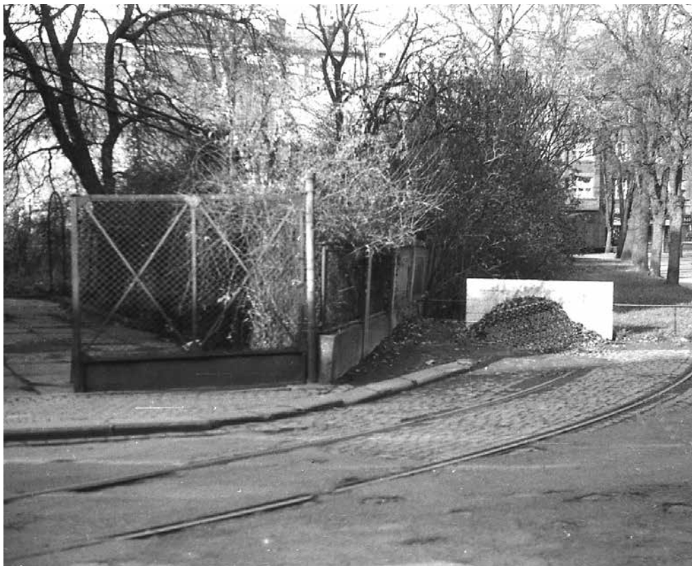
▲ Pohled na trať v Šalounově ulici krátce po ukončení provozu, již bez trolejového vedení

Jako připomínka této dráhy je na domě na ulici Šalounova č. 625/33 instalována pamětní tabule, která byla slavnostně odhalena v pondělí 5. června 2023. Pro účastníky byl také zdarma k dispozici číslovaný pamětní list vydaný v počtu 100 kusů. Zbýlé pamětní listy byly k dispozici k rozebrání ve schránce vedle pamětní tabule. Poslední pamětní list si zájemce vyzvedl na začátku března 2024.