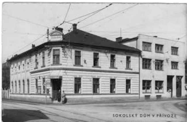
▲ Sokolský dům v Přívoze