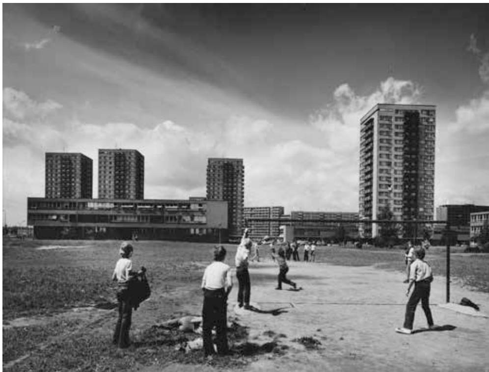
▲ Petr Sikula, Ostrava, 1987

Část Sikulových fotografií ostravské architektury 70.–80. let je dnes v majetku Archivu města Ostravy, jiné se objevily v digitální podobě na jeho jubilejní výstavě ve Fotografické galerii Fiducia v roce 2021. Celý konvolut přibližně 800 fotografií je nicméně neobvykle rozsáhlým a konzistentním celkem, jehož úplné zpracování a publikace představuje výrazný přínos ke sdílené kolektivní paměti Ostravy i normalizace obecně.