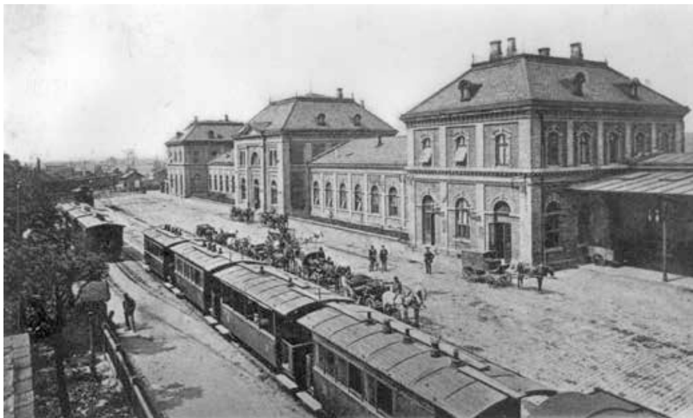
▲ Počáteční výhybna místní dráhy Přívoz – Mor. Ostrava – Vítkovice v přednádražním prostoru stanice Severní dráhy císaře Ferdinanda Mor. Ostrava-Přívoz se dvěma osobními soupravami mezi lety 1894 a 1896

parní motorové vozy a parní lokomotivy. Ty později vystřídaly hřmotné obousměrné elektrické motorové a vlečné vozy různé konstrukce a původu. Překotný poválečný vývoj však zásadně změnil charakter této kolejové dopravy v regionu. Postupně do roku 1973 došlo ke zrušení celé úzkorozchodné sítě a zbývající normálněrozchodné místní a drobné dráhy na území města Ostravy se buď přerodily v současný tramvajový systém s rychlodrážními prvky a moderními vozidly, nebo byly zrušeny.