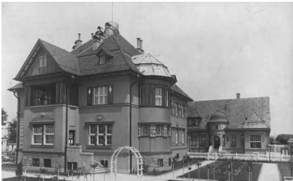
▲ Pohled na vilu se zahradou, vpravo navazující kancelářská budova s obytným podkrovím, 1924