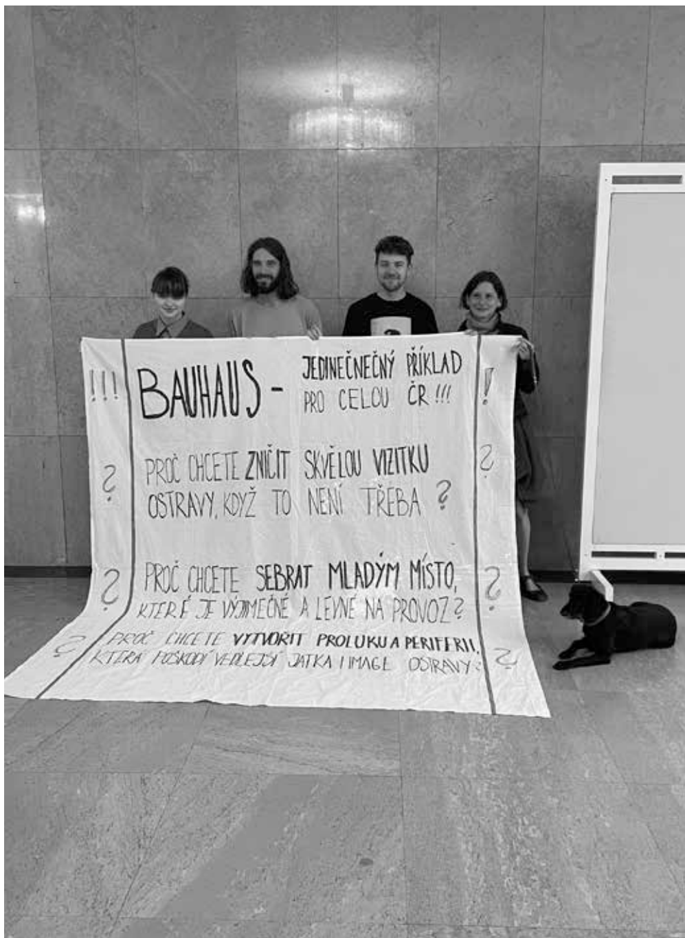
▲ Iniciativa Bauhaus končit nemusí před sálem Zastupitelstva města Ostravy v květnu 2024