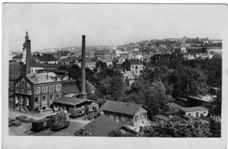
▲ Strassmannův pivovar