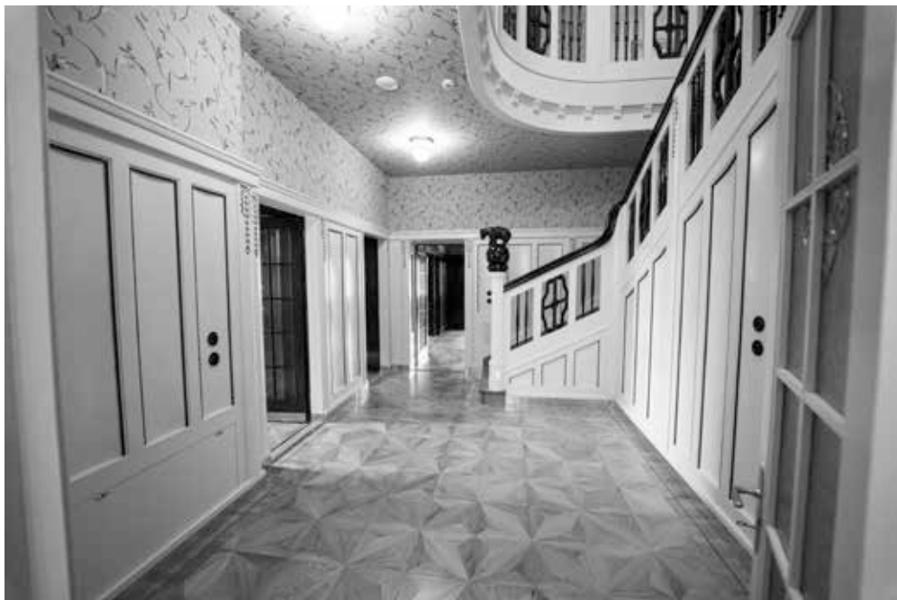
▲ Centrální hala se schodištěm po rekonstrukci, 2024