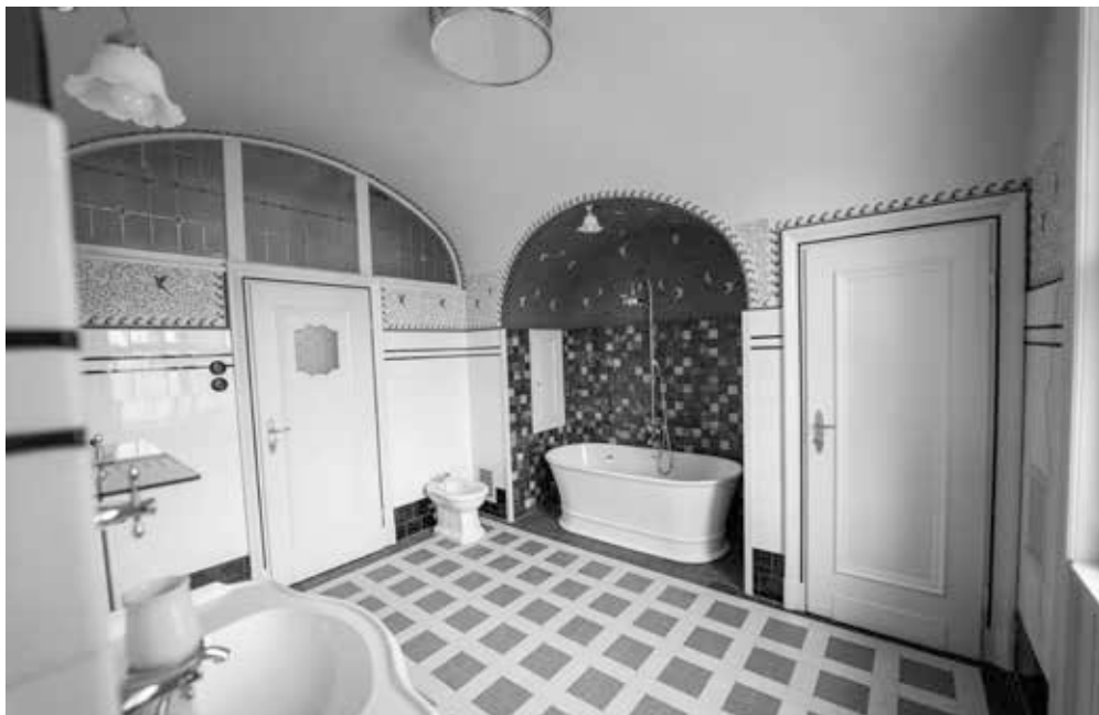
▲ Koupelna po rekonstrukci, 2024