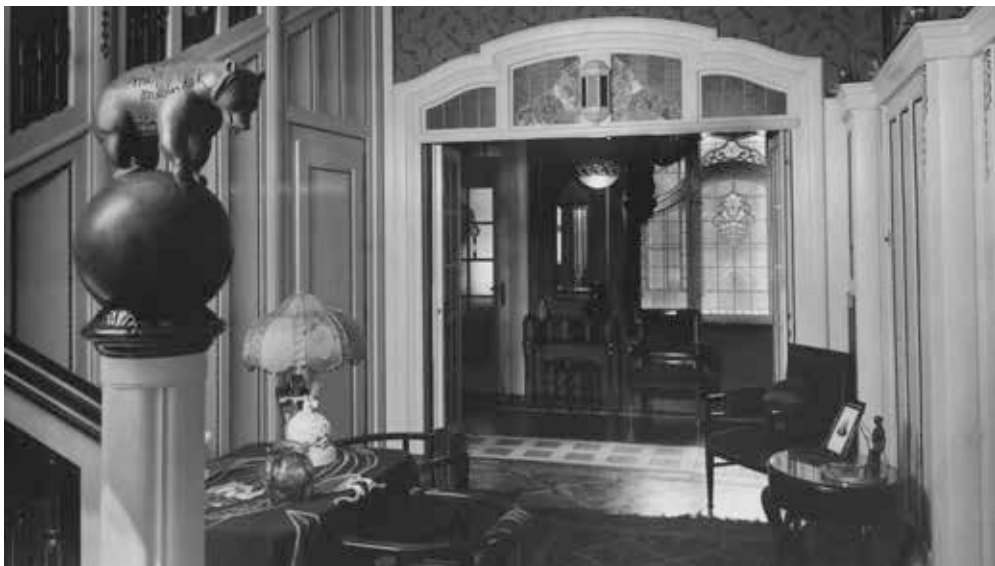
▲ Centrální dvoupodlažní schodišťová hala v přízemí s přílehlou šatnou u vstupu, 1924

dami a vysokým, zčásti kamenným soklem. Její hlavní průčelí bylo obráceno do ulice Dr. Richtera (dnes Na Zapadlém). Hmotu akcentovaly různé prvky – zelené okenice, dřevěná zimní zahrada s filigránským dekorem, strmá valbová střecha a dekorativně pojaté komíny. Nad některými okny v přízemí je patrný štukový rostlinný dekor, mezi okny půlkruhového arkýře se nacházejí figurální reliéfy v podobě hravých putti. Dům je podsklepen, do suterénu se vstupuje dvouramenným obslužným schodištěm, situovaným v severovýchodním nároží. Kotelna byla jako jedna z prvních na Ostravsku vybavena kotlem s rozvody teplovzdušného vytápění, přičemž zmíněný kotel se zachoval až do současnosti.