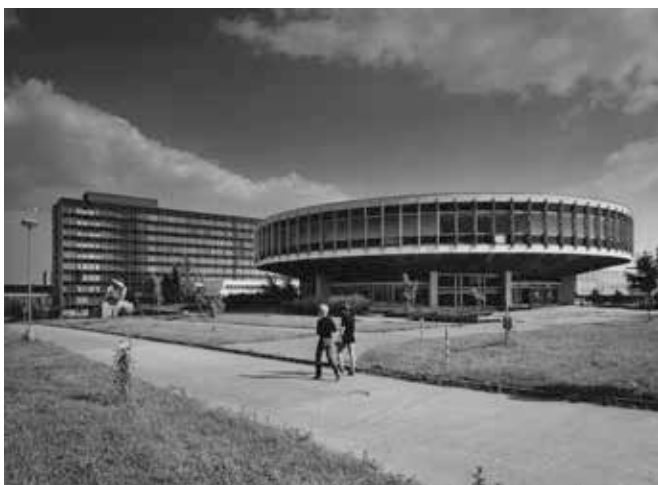
▲ Petr Sikula, Ostrava, areál VŠB, 1987