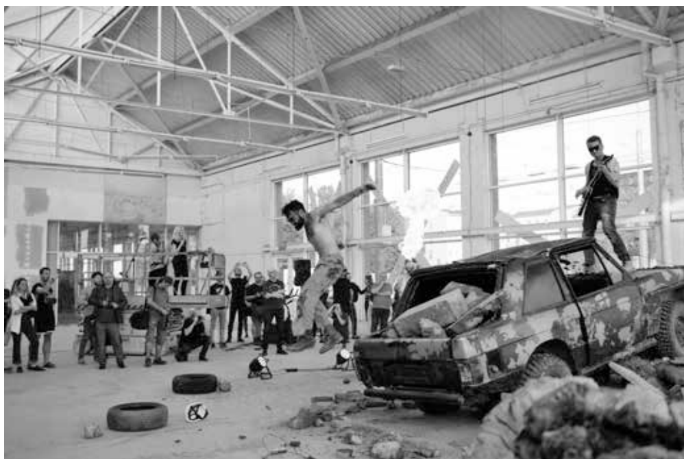
▲ PLATO-Bauhaus, 2018