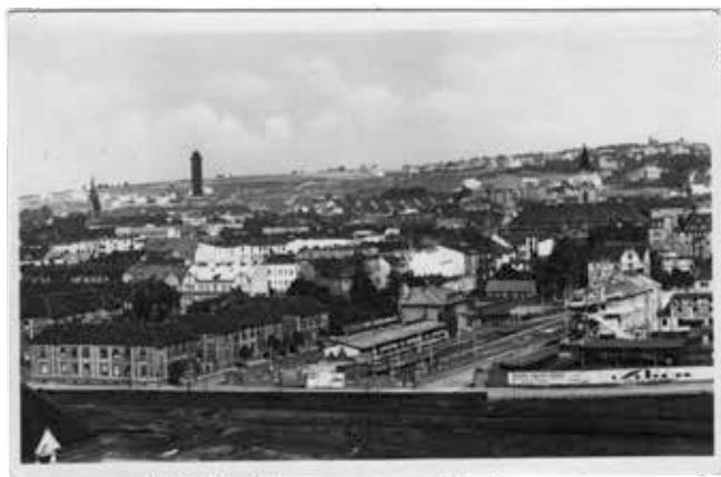
◀ Nákladní nádraží Zahrada