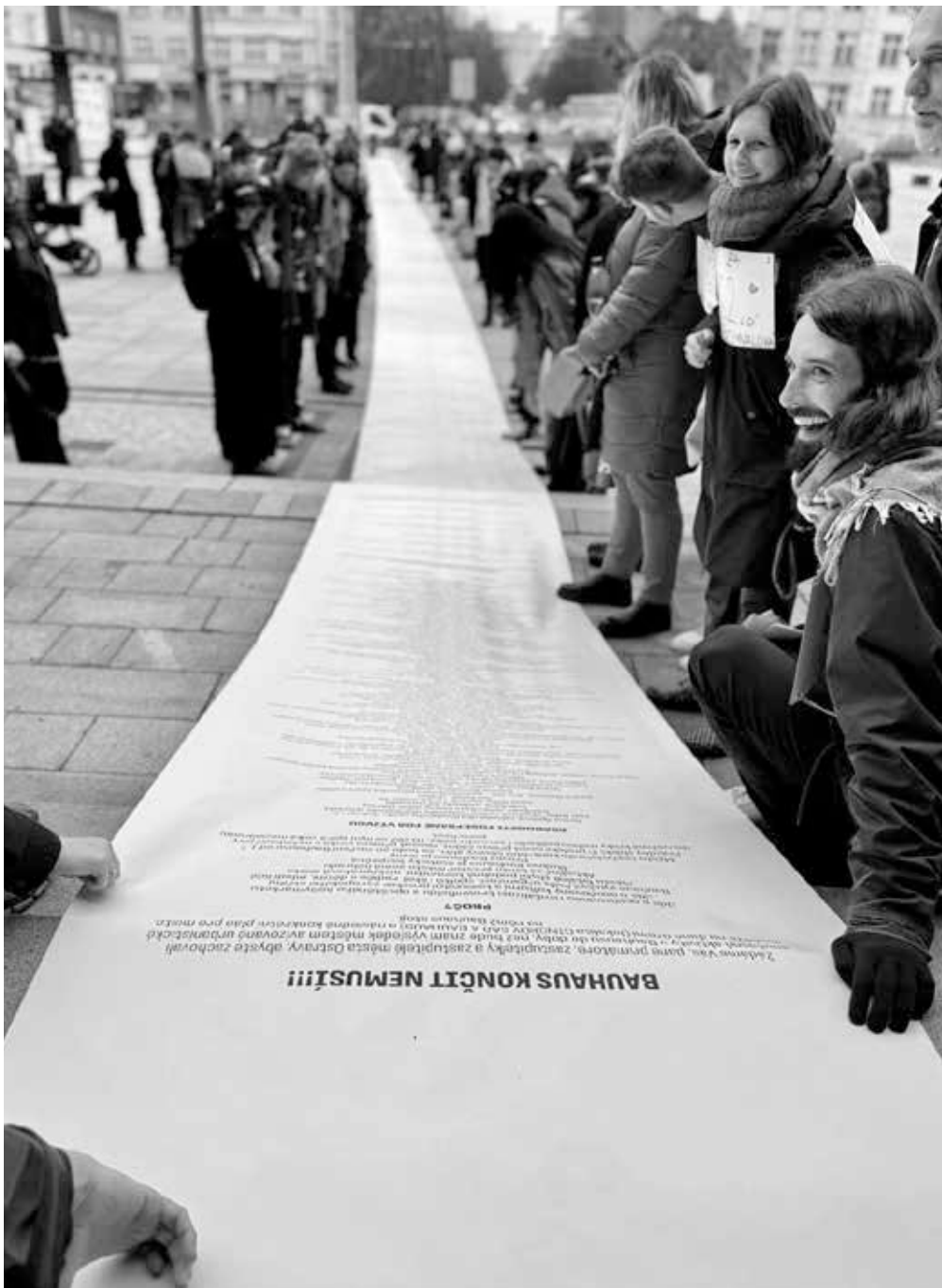
▲ Podpůrná stanoviska veřejnosti k Bauhausu zabrala plochu od radnice až na konec Prokešova náměstí (z akce Štafeta pro Bauhaus, únor 2024).