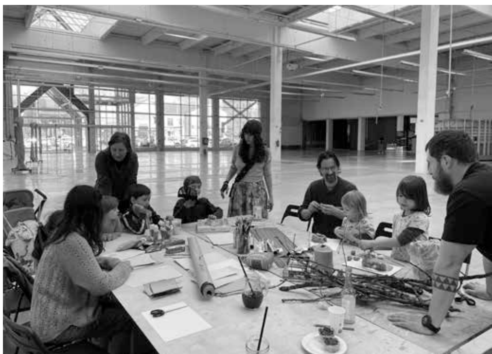
▲ PLATO-Bauhaus, workshopy pro děti