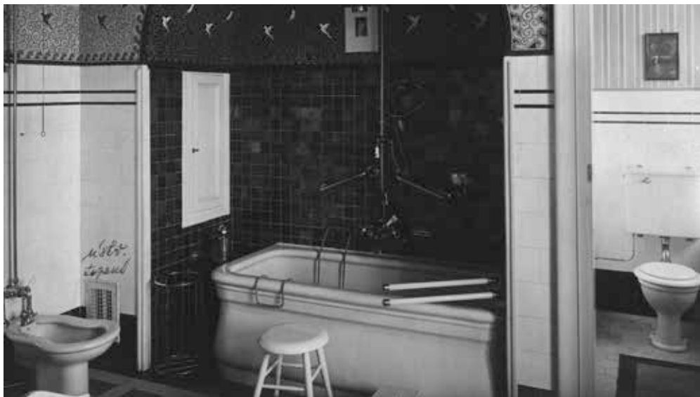
▲ Koupelna s toaletou v 1. patře, 1924

s rostlinným dekorem. Mezi oběma ložnicemi byla situovaná velká koupelna s toaletou, laděná do bílé a blankytně modré barvy, s výmalbou s motivy ptáčků. Ze schodišťové haly byl také přístupný pokoj v severním traktu a komora se šatními skříněmi (šicí komora). V této části se nacházely i dva pokoje pro služky s vlastním příslušenstvím a boční schodiště v polygonálním rizalitu, které vedlo až do podkrovní s prádelnou a mandlovnou. Z půdního prostoru byla vřetenovým schodištěm přístupná kruhová vyhlídka na střeše.