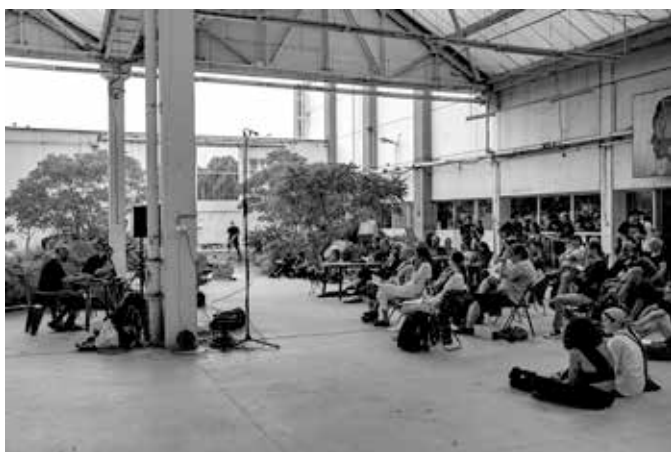
▲ PLATO-Bauhaus, 2019