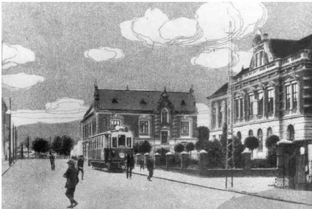
▲ Motorový vůz Slezských zemských drah jedoucí z Ostravy do Bohumína u německé národní chlapecké a dívčí školy na Hlavní ulici (nyní Stará cesta) v Hrušově mezi lety 1914 a 1918