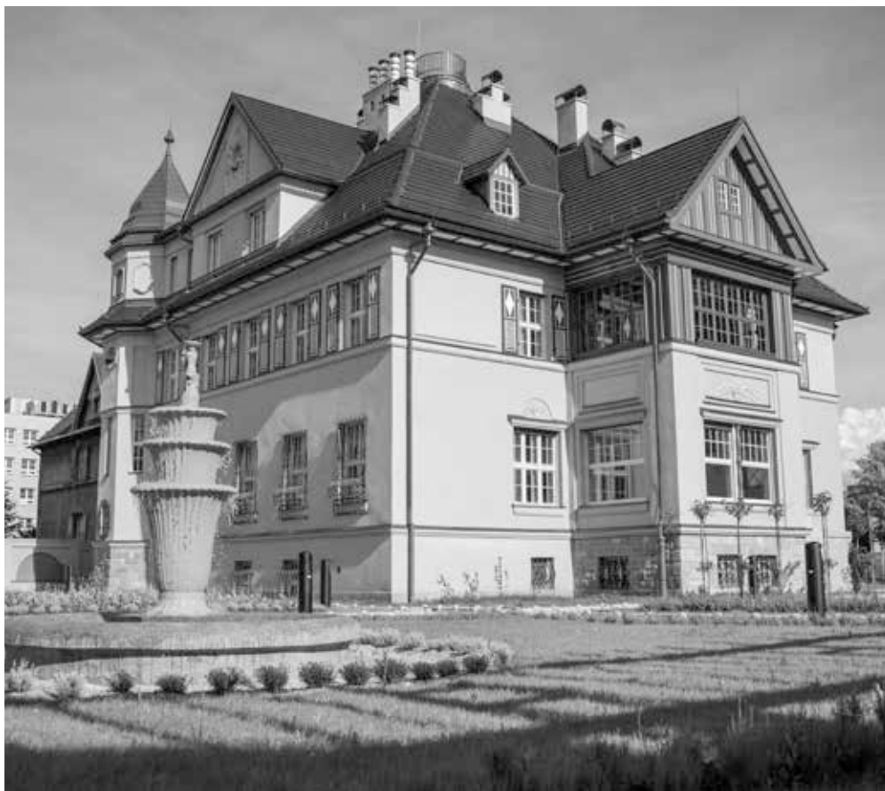
▲ Vila se zahradou po rekonstrukci, 2024

společným pojmenováním Moravská Ostrava, za éry první Československé republiky.