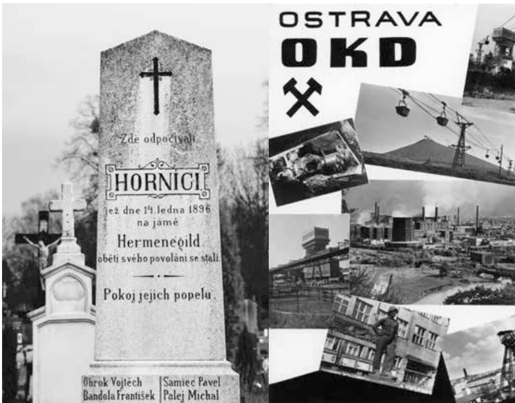
▲ Hrob šestnácti horníků zemřelých při důlním požáru. Slezská Ostrava. Foto Ondřej Durczak, 2023