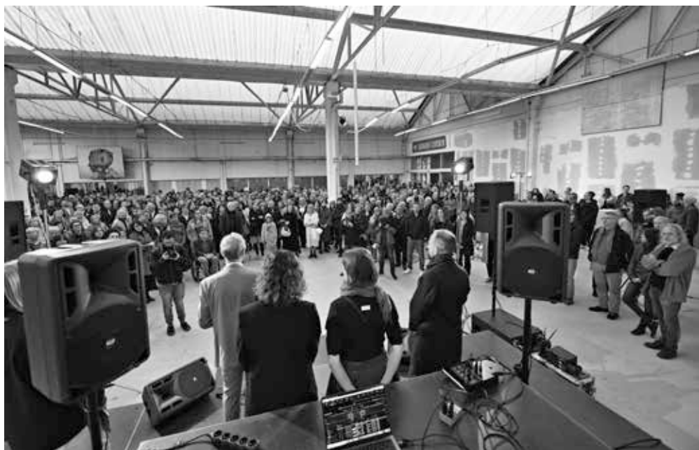
▲ PLATO-Bauhaus, 2022