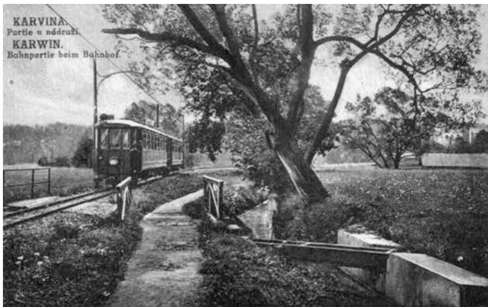
▲ Tramvajový vlak ostravsko-karvinské dráhy v koncovém úseku trati mezi stanicemi Karviná pivovar a Karviná nádraží mezi lety 1909 a 1910. Provoz v této části původní místní dráhy Ostrava–Karviná byl zastaven z důvodu poddolování 1. 6. 1964