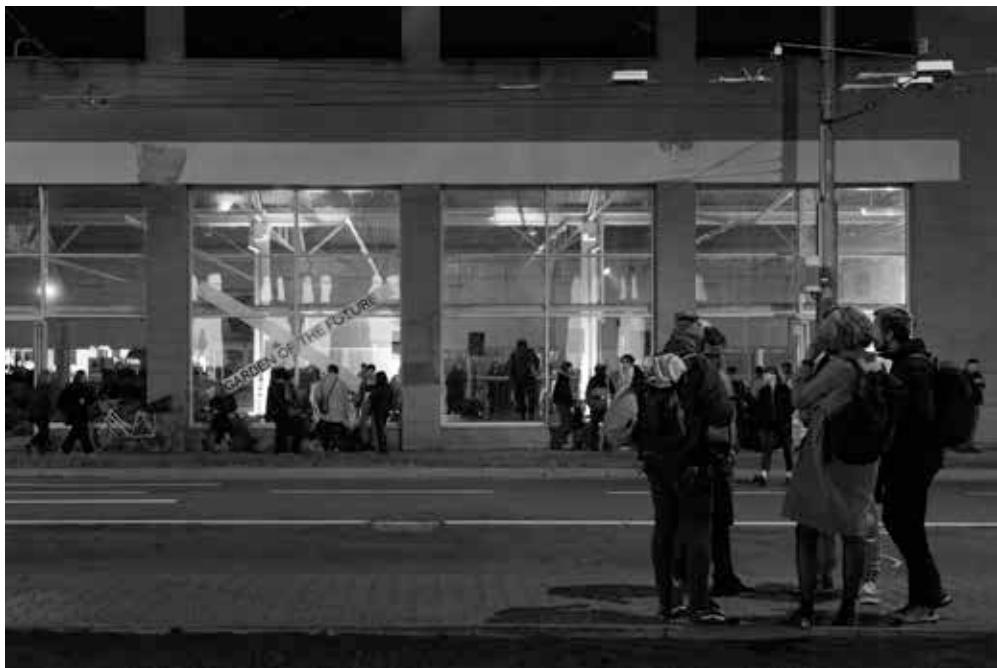
▲ PLATO-Bauhaus, 2022