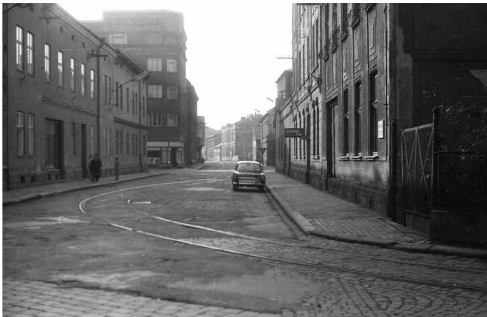
▲ Pohled na trať v Šalounově ulici krátce po ukončení provozu, již bez trolejového vedení