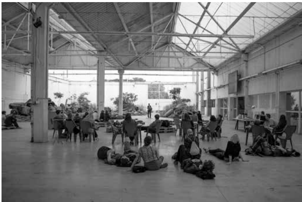
▲ PLATO-Bauhaus, koncert s rozbřeskem, 2019