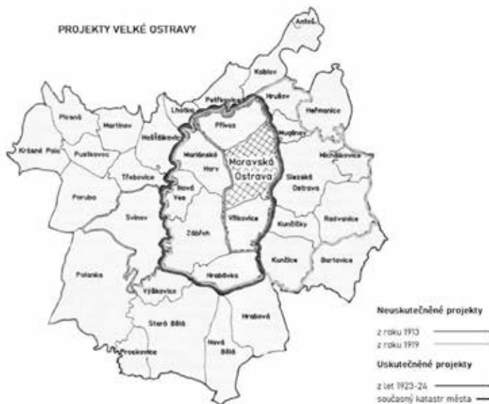
▲ Mapa projektů Velké Ostravy z webu Historická Ostrava

V důsledku tohoto podání se na všechny obce vztahovalo ustanovení zákona č. 295/1919 Sb., které zmocňovalo ministerstvo vnitra v případech, kde se jednalo o sloučení obcí, aby před sloučením jmenovalo pro všechny tyto obce správní komise. Ve všech ostravských obcích, v nichž se tak dosud nestalo, byla proto nahrazena obecní zastupitelstva správními komisemi, jež byly ministerstvem pověřeny k přípravě voleb v nově sloučené obci.