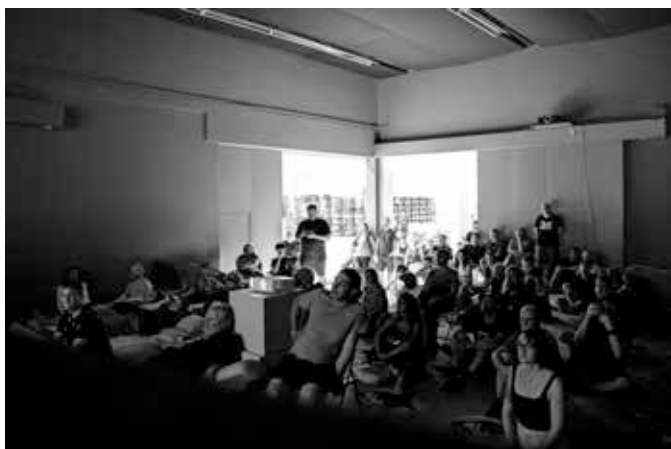
▲ PLATO-Bauhaus, 2023